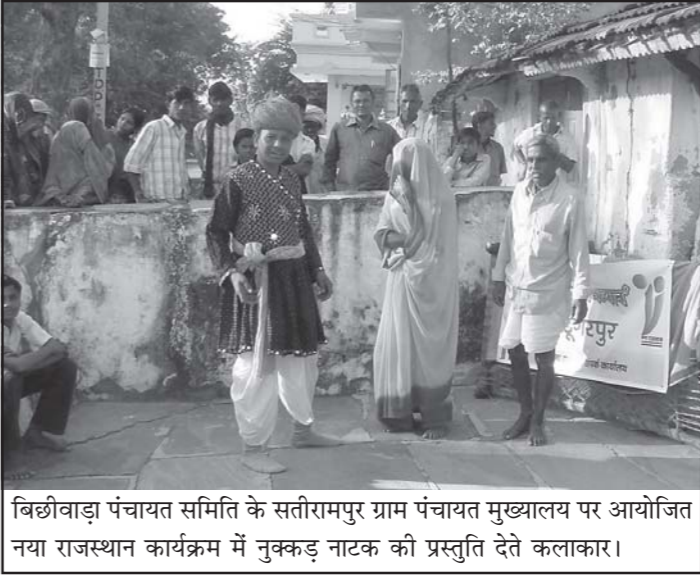
बिछीवाड़ा पंचायत समिति के सतीरामपुर ग्राम पंचायत मुख्यालय पर आयोजित नया राजस्थान कार्यक्रम में नुक्कड़ नाटक की प्रस्तुति देते कलाकार।