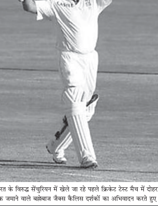
भारत के विरुद्ध संचुरियन में खेले जा रहे पहले क्रिकेट टेस्ट मैच में दोहरा शतक जमाने वाले बल्लेबाज जैक्स कैलिस दर्शकों का अभिवादन करते हुए।

थानाप्रभारी ने बताया कि रिपोर्ट के अनुसार प्रार्थिया की गोर्गुंदा में श्री धानमंडी थाने में मामला दर्ज कराया गया। पुलिस ने आरोपी को गिरफ्तार कर जांच शुरू कर दी है।