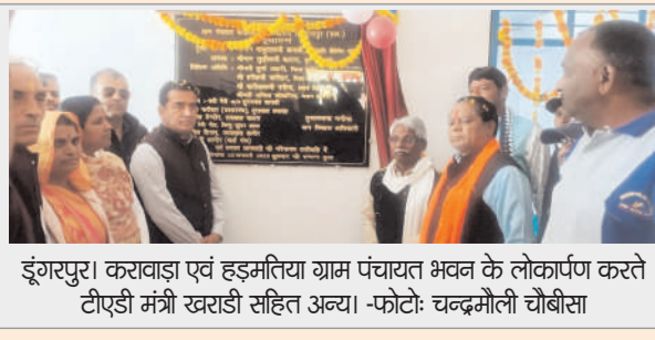
डूंगरपुर। करावाड़ा एवं हड़मतिया ग्राम पंचायत भवन के लोकार्पण करते टीपीडी मंत्री खराड़ी सहित अन्य।

सौमलवाड़ा(पुकार)। डूंगरपुर जिले के प्रभारी मंत्री बाबूलाल खराड़ी शुक्रवार को डूंगरपुर जिले के एक दिवसीय दौरे पर रहे। अपने दौरे के दौरान प्रभारी मंत्री खराड़ी ने चौरासी विधानसभा क्षेत्र में करावाड़ा व हड़मतिया पंचायत के नवनिर्मित भवनों का लोकार्पण किया। इस मौके पर प्रभारी मंत्री ने लोकार्पण समारोहों को संबोधित करते हुए सरकार की उपलब्धियों को गिनाया। डूंगरपुर पहुंचने पर