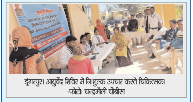
डूंगरपुर। आयुर्वेद शिविर में निःशुल्क उपचार करते चिकित्सक।