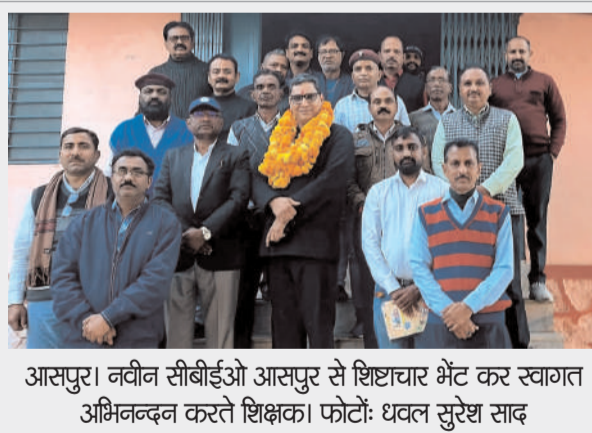
आसपुर। नवीन सीबीईओ आसपुर से शिष्टाचार भेंट कर स्वागत अभिनन्दन करते शिक्षक।