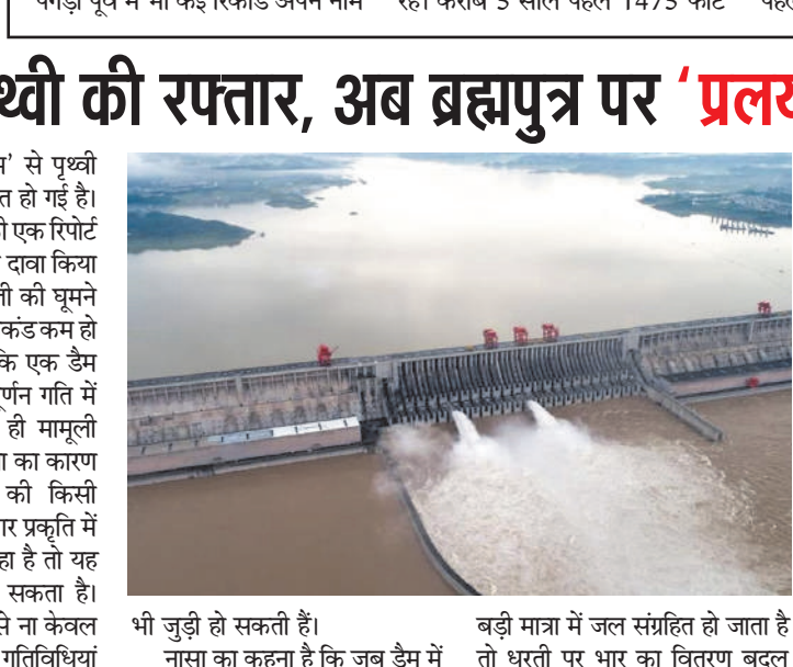
बी जुड़ी हो सकती है। नासा का कहना है कि जब डैम में बड़ी मात्रा में जल संग्रहित हो जाता है तो धरती पर भार का वितरण बदल

बीकानेर (पुकार)। राजस्थान के बीकानेर में अंतरराष्ट्रीय ऊंट उत्सव पूरी दुनिया में अपनी पहचान रखता है। अंतरराष्ट्रीय उत्सव के पहले दिन बीकानेर के एक युवा ने अब तक की सबसे लंबी पगड़ी बांधकर विश्व रिकॉर्ड कायम किया। 2025 फीट की पगड़ी पूर्व में भी कई रिकॉर्ड अपने नाम