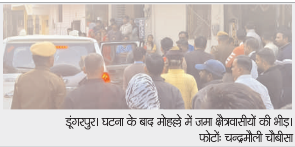
डूंगरपुर। घटना के बाद मोहल्ले में जमा क्षेत्रवासियों की भीड़।

डूंगरपुर(पुकार)। शहर के कोतवाली थाना क्षेत्र के हाउसिंग बोर्ड क्षेत्र में 13 वर्षीय छात्रा घर पर फंदे से लटकी मिली। 7वीं में पढ़ने वाली स्टूडेंट पेट दर्द की शिकायत के चलते स्कूल से जल्दी घर लौट गई थी। शहर कोतवाल भावान लाल ने बताया कि छात्रा और उसके भाई गांव से डूंगरपुर के स्कूल में पसने थे। स्कूल के बाद शहर के घर में शाम तक रहते थे। वही