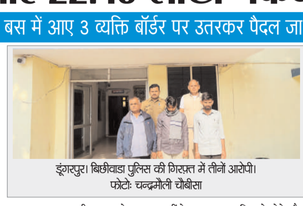
डूंगरपुर। बिछीवाड़ा पुलिस की गिरफ्तार में तीनों आरोपी।

डूंगरपुर(पुकार)। राजस्थान-गुजरात बॉर्डर पर पुलिस ने डेढ़ किलों सोना और साढ़े 22 लाख नकदी के साथ 3 लोगों को गिरफ्तार किया है। तीनों बॉर्डर से पहले एक निजी बस से उतरे और पैदल बॉर्डर क्रॉस कर रहे थे। फिलहाल पुलिस युवकों से सोना और नकदी को लेकर पूछताछ कर रही है। मामला डूंगरपुर जिले के रतनपुर बॉर्डर का है। बिछीवाड़ा थानाधिकारी ने बताया कि गुरुवार देर रात को मुखबीर से सूचना मिली कि एक ट्रेलर बस के जॉरिए 3 युवक अवैध रूप से सोना और नकदी लेकर जा रहे हैं। इस पर पुलिस ने रतनपुर बॉर्डर पर नाकाबंदी की। इस दौरान एक ट्रेलर बस से 3 युवक उतरकर पैदल जाने लगे। युवकों के पास एक थैला था। पुलिस ने तीनों युवकों को हकतें सिद्ध लगने पर