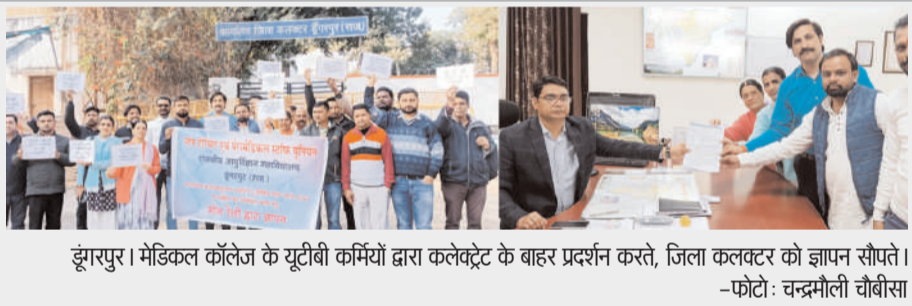
डूंगरपुर। मेडिकल कॉलेज के यूटीबी कर्मियों द्वारा कलेक्ट्रेट के बाहर प्रदर्शन करते, जिला कलक्टर को ज्ञापन सौंपते।