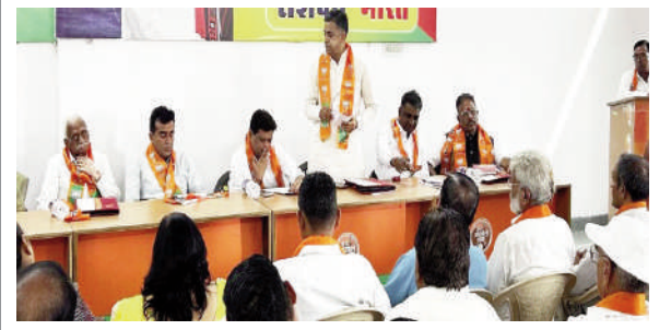
■ डूंगरपुर। संगठन पर्व की कार्यशाला में शामिल भाजपा कार्यकर्ता।

संगठन पर्व के के सह प्रभारी प्रभु पंड्या ने बताया की संगठन पर्व में संगठन संरचना का जरिया है भारतीय जनता पार्टी एक परिवार है जिसमें किसी भी कीमत पर संगठन में चुनाव की स्थितिना ना बने और किसी भी प्रकार निर्णय मात्र सर्वसहमति से हो क्योंकि इसे